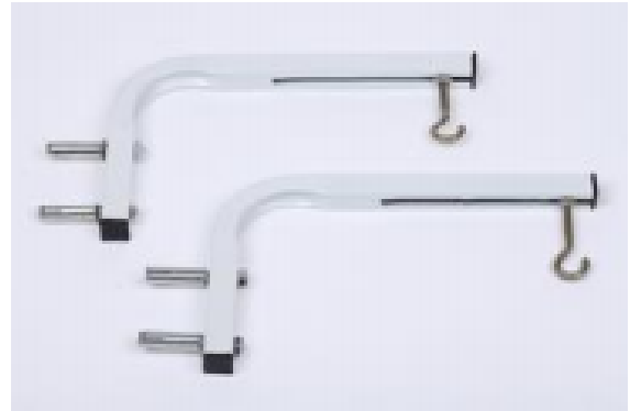
Support d'écran Mural/plafonnier