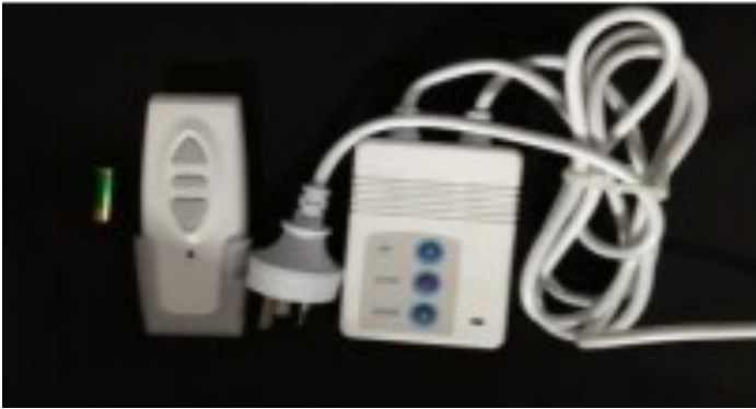
Télécommande infrarouge & boîtier de pilotage mural (Piles incluses)